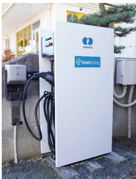
実証用EV双方向充電器