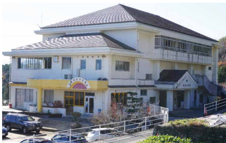
ウマバ・スクールコテージ外観